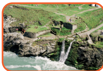
Cornwall - Tintagel