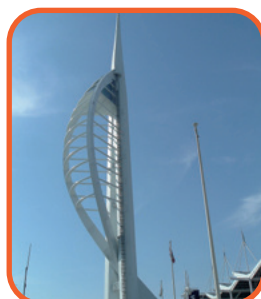
Portsmouth - Spinnaker Tower