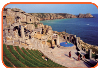
Cornwall - Minack Theatre