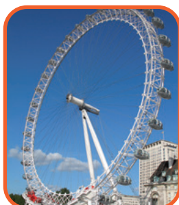
Londýn - London Eye