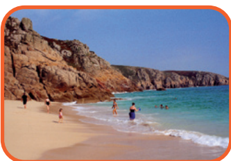
Cornwall - pláž u Porthcurno