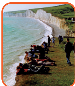
Eastbourne - křídové útesy