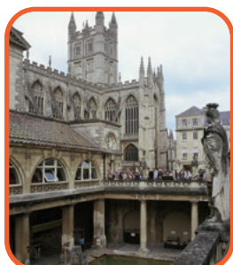
Bath - Římské lázně