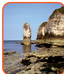
Sev. Anglie - Flamborough Head