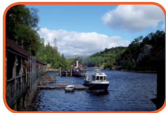
Skotsko - Loch Katrine