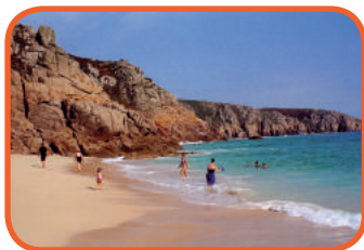
Cornwall - pláž u Porthcurno