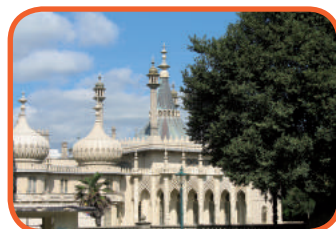
Brighton - Královský pavilion