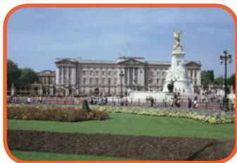
Londýn - Buckingham Palace