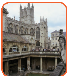
Bath - Římské lázně