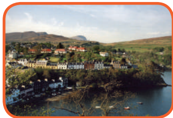
Skotsko - Skye - Portree