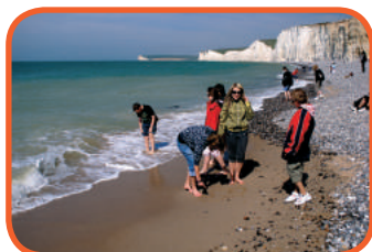
Křídové útesy - Eastbourne