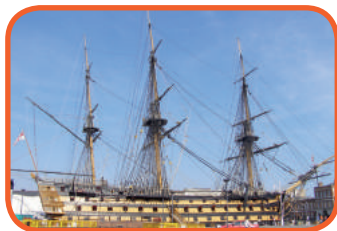
Portsmouth - Victory