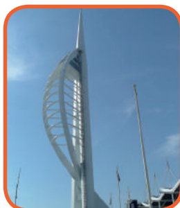
Portsmouth - Spinnaker Tower