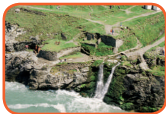
Cornwall - Tintagel