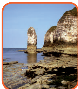
Sev. Anglie - Flamborough Head