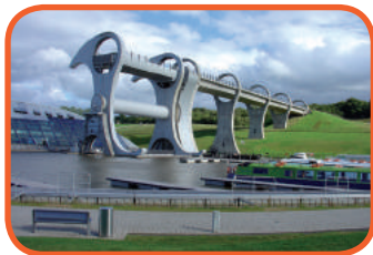
Skotsko - Falkirk Wheel