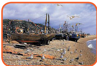
Hastings - přístav