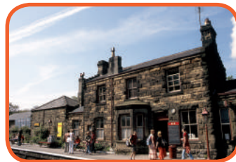
Severní Anglie - Goathland