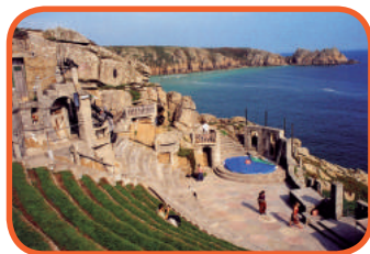
Cornwall - Minack Theatre